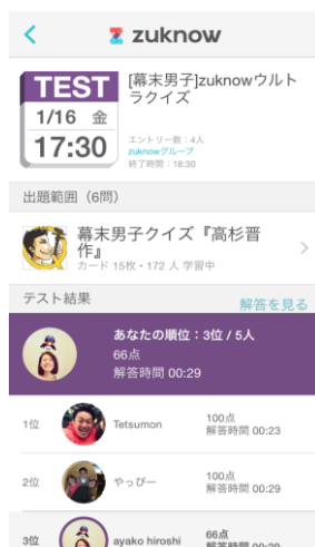
グループでの「斉テスト」結果(ランキング)画面