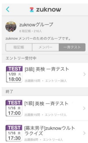
グループでの「斉テスト」エントリー画面

「斉テスト」は、エントリーしたユーザーが同じ条件でテストを受けた後にその結果がランキングで発表される、同じ目的に向かって学習する人同士の競い合いを促進できる機能です。