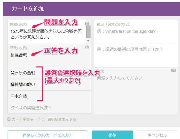
選択式クイズ問題 作成ツール(Web版)