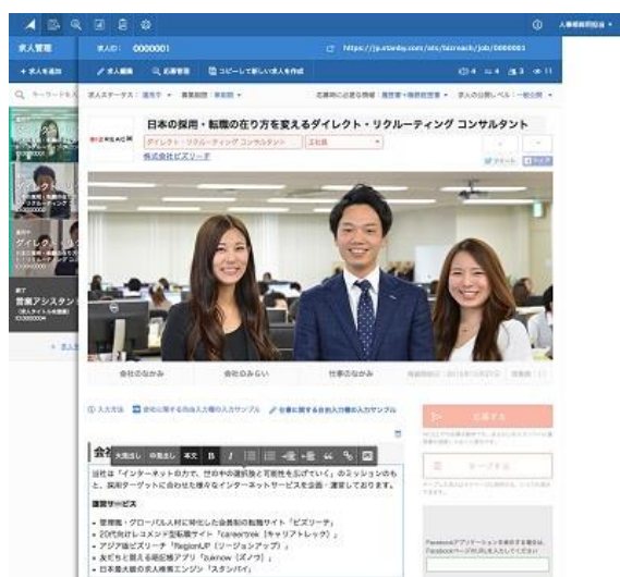
【求人作成・編集ページ】 実際に掲載される求人ページと 同じ画面上で求人作成・編集可能